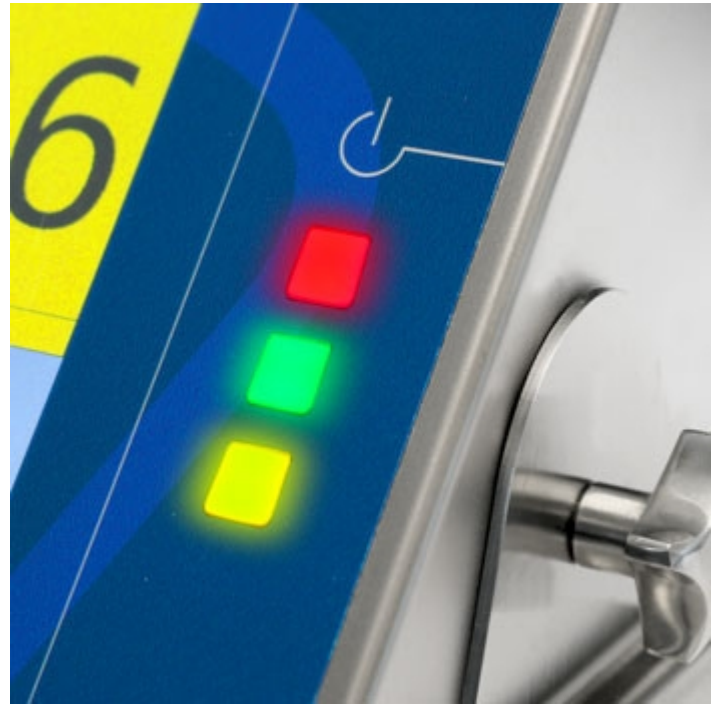
Semaforo LED ad alta luminosità.