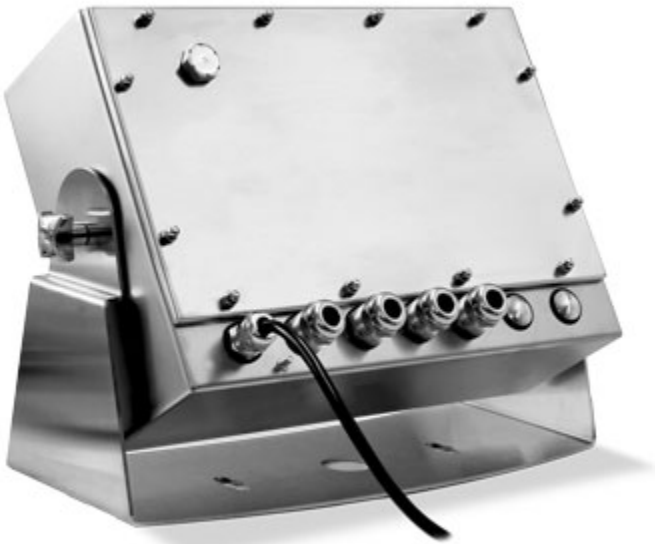
Pannello posteriore predisposto per uscite supplementari