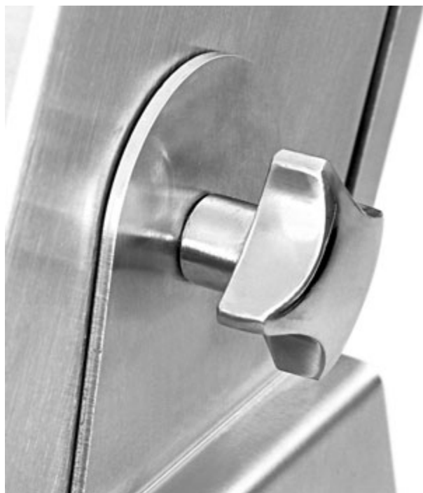
Sistema di regolazione dell'inclinazione in acciaio INOX