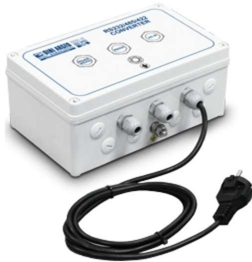
C232485: Convertitore RS232 / RS485 per utilizzo da banco