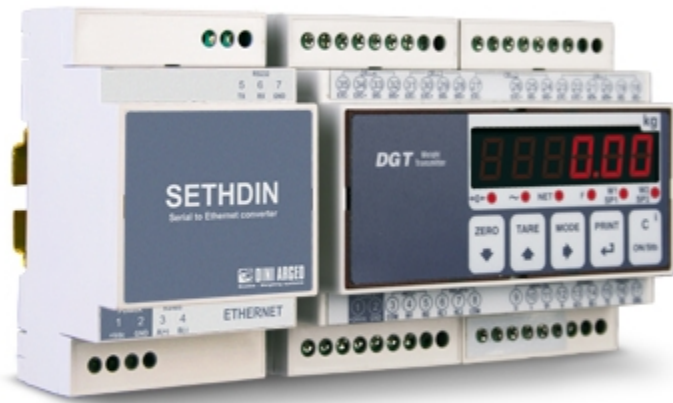
SETHDIN: Esempio d'installazione con DGT4